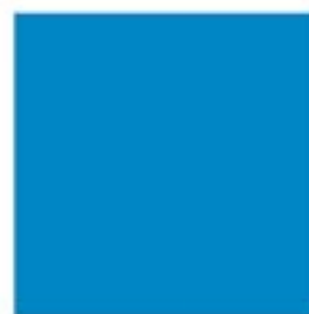
PANTONE 348 C